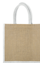
Toile de jute